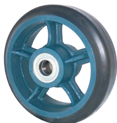
重量用 ゴム車輪 HB型