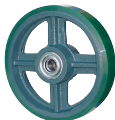
標準ウレタンゴム車輪 UB型