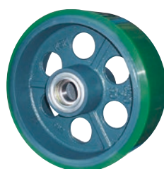
超重量用 ウレタンゴム車輪UHB型