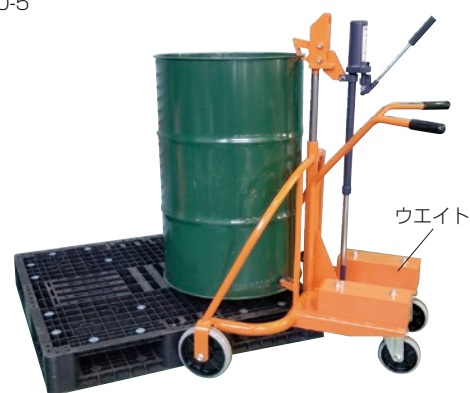
CD300-4W パレット角取り仕様ウエイト式 4輪タイプ