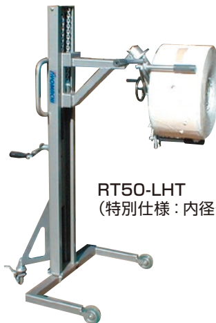
RT50-LHT (特別仕様：内径外径チャックタイプ)