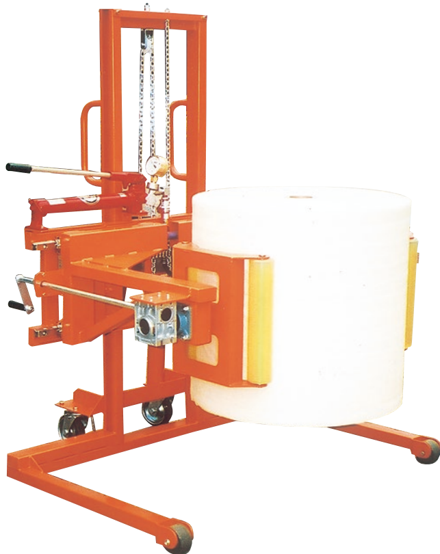
GRHL300LHT (大型ロール対応縦回転タイプ)