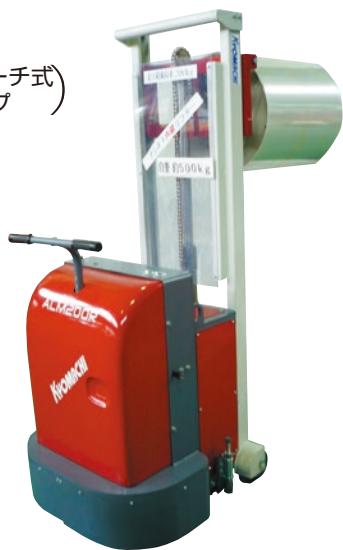
ALM200RR (アシストリフトリーチ式) (ラムフォークタイプ)