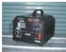
充電器別置 (付属品)