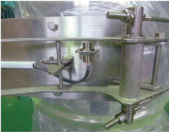
クランプ検知センサ付