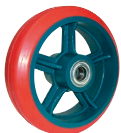
重量用 ジェーンゴム車輪HB型