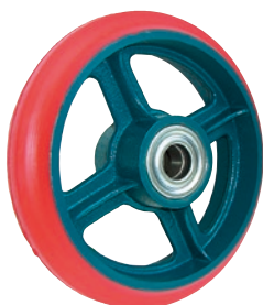
標準ジェーンゴム車輪 GB型