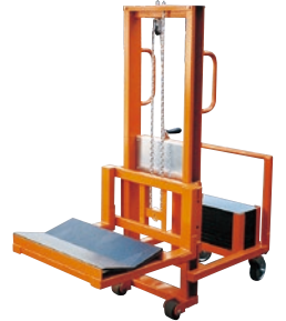
125 ハンドリフト(手巻) ●荷重100kg ●後部バランスウェイト式 ●巻ロール受け用