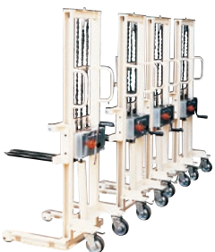
127 ハンドリフト(手巻) ●荷重350kg ●特型