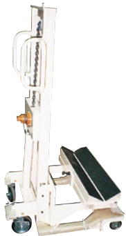
121 ハンドリフト(手巻) ●荷重250kg ●巻ロール受け用