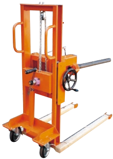
116 ハンドリフト(手巻) ●荷重150kg ●ラムフォーク式