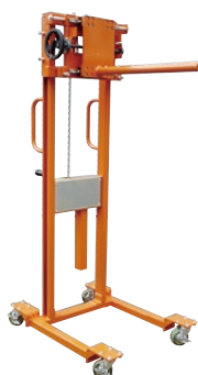
133 ハンドリフト(手巻) ●荷重150kg ●横スライド式ラムフォーク