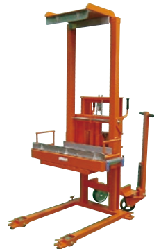
130 ハンドリフト(手巻) ●荷重300kg ●手引ハンドル