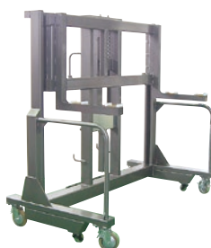
132 ハンドリフト(手巻) ●荷重350kg ●前後輪自在