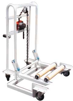
117 ハンドリフト(手巻) ●荷重50kg ●キャリーリフト ●CLBローラー付