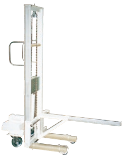
126 ハンドリフト(手巻) ●荷重100kg ●長尺フォーク付