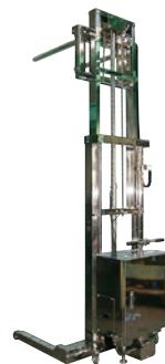
134 ハンドリフト(手巻) ステンレス仕様 ●荷重300kg ●アシスト内蔵 ●2本ラムフォーク