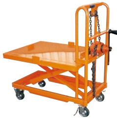
123 ハンドリフト(手巻) ●荷重200kg ●巻き揚げタイプ ●テーブル式