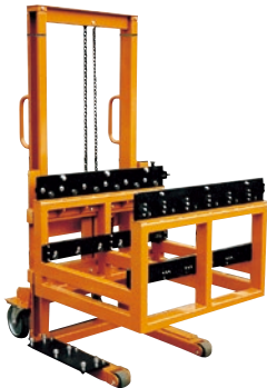
122 ハンドリフト(手巻) ●特種タイプ