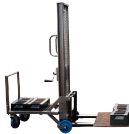
124 ハンドリフト(手巻) ●荷重100kg ●後部バランスウェイト式