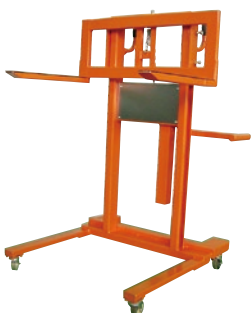
131 ハンドリフト(手巻) ●荷重300kg ●前後輪自在