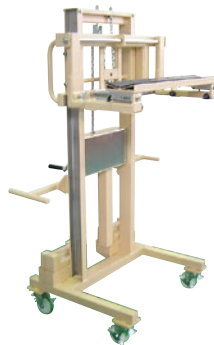
128 ハンドリフト(手巻) ●荷重350kg ●前後輪自在