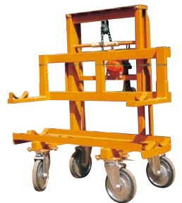
120 ハンドリフト(手巻) ●荷重100kg ●巻ロール受け用