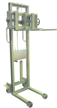
129 ハンドリフト(手巻) ●荷重100kg ●フォークスライド式