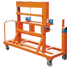
119 ハンドリフト(手巻) ●荷重150kg ●横巻きタイプ