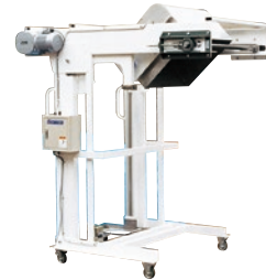
199 インバーションリフト ●IWC横行タイプ ●荷重250kg ●ステン容器着脱式