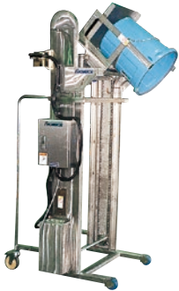
201 インバーションリフト ステンレス仕様 ●ILC●荷重100kg ●70Rポリベール用