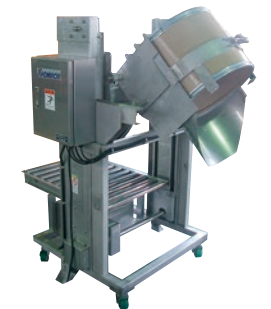
205 インバーションリフト ●ILC●荷重80kg ●ファイバードラム用