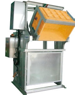
204 インバーションリフト ステンレス仕様 ●SILC●荷重500kg ●防雨タイプ