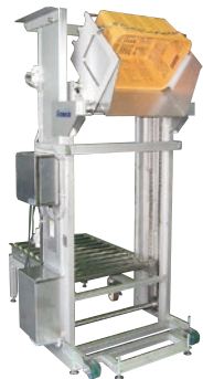
206 インバーションリフト ステンレス仕様 ●ILC●荷重80kg ●樹脂コンテナ用