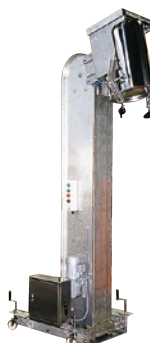
208 インバーションリフト ステンレス仕様 ●ILO●荷重100kg ●ステン容器用