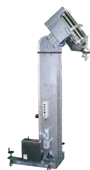
209 インバーションリフト ステンレス仕様 ●ILO●荷重100kg ●薬品容器用