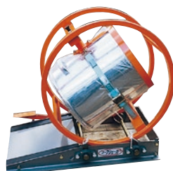
212 シェーカー ●DHS-50 ●特殊容器仕様