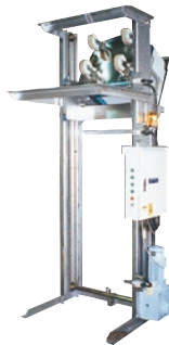
202 インバーションリフト ステンレス仕様 ●ILC●荷重200kg ●台車ごと反転 ●防水タイプ