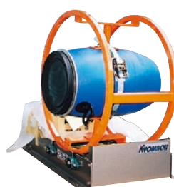
213 シェーカー ●DHS-100 ●プラスチックドラム仕様