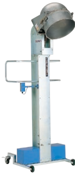
198 インバーションリフト ●ILO●荷重50kg ●ステンボール用 ●100V/200V