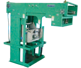
200 インバーションリフト ●IWC ●荷重300kg ●水平移動タイプ