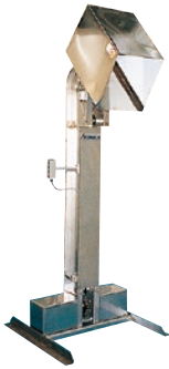
196 インバーションリフト ●TLM ●荷重500kg ●油圧式