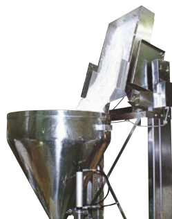
207 インバーションリフト ステンレス仕様 ●ILB●荷重30kg ●粉袋用