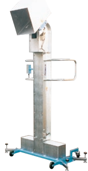
197 インバーションリフト ●ILO ●荷重50kg ●軽荷重タイプ