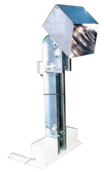
210 インバーションリフト ステンレス仕様 ●ILO ●荷重50kg